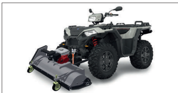
BROYEUSE FM100 RYKOV

Marque: Rykov Largeur: 1000 mm Moteur: 9 HP, Honda GX-270 Modèle: FM 100 Prix: Fr. 3'390.- Tva incl. Support pour quad: Fr. 100.- Tva incl.