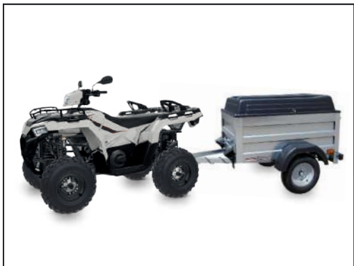
CRESCI H3 S.F. (Remorque pour quad)