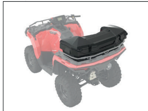
CARGO BOX ARRIÈRE [#2884853]