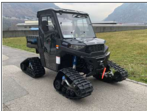
KIT CHENILLES [#2889487]