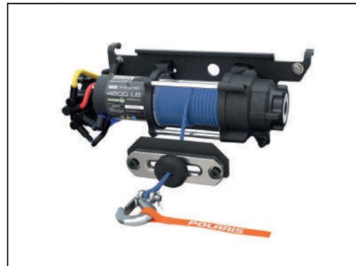
TREUIL PRO HD 4'500 LB [#2882711]