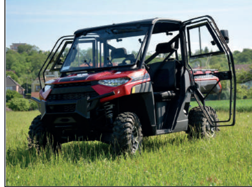
KIT CABINE COMPLÈTE [#DFK-32S12U01-1]