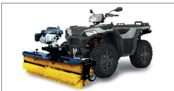
BROSSE MK 130 PROFI RYKOV

Art. N. RY - 1650-00.000 RY - 1017-00.000