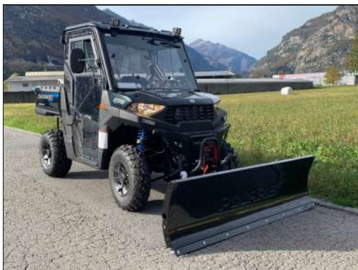
KIT LAME À NEIGE RANGER 570