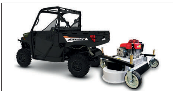
TONDEUSE FD 120 RYKOV

Art. N. RY - 1325-00.000 RY - 1017-00.000