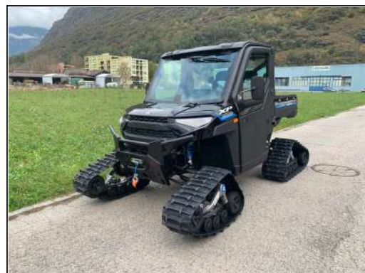
KIT CHENILLES [#2883313]