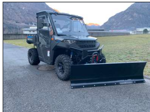
KIT LAME À NEIGE RANGER 1000