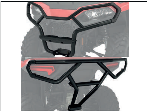
BUMPER AV/ARR [#2884844/#2884847]