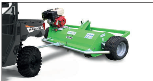
BROYEUSE MOTOFOX PERUZZO

Marque: Peruzzo Largeur: 1200 mm Moteur: 13/18 HP Briggs & Stratton Modèle: Moto Fox Prix: de Fr. 4'423.- Tva incl.