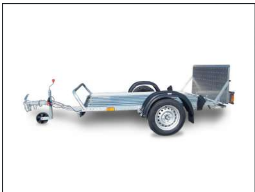
CRESCI PT4 S.F.