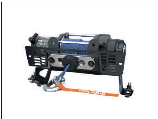
TREUIL PRO HD 4'500 LB [#2882238]