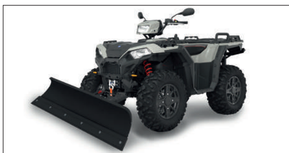
LAME À NAIGE ATV 150 RYKOV

Marque: Rykov Largeur: 1500 mm Modèle: ATV 150 Prix: Fr. 590.- Tva incl. Support pour quad: Fr. 100.- Tva incl.