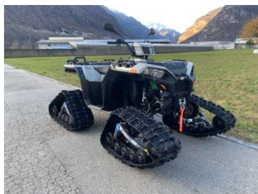
KIT CHENILLES [#2881003]