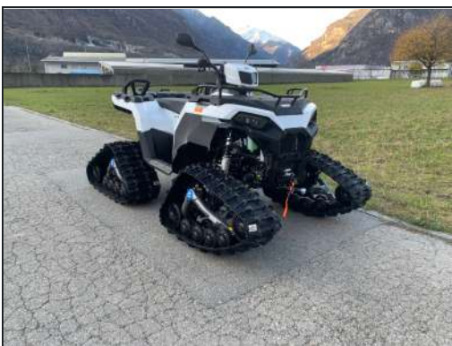
KIT CHENILLES [#2880020]