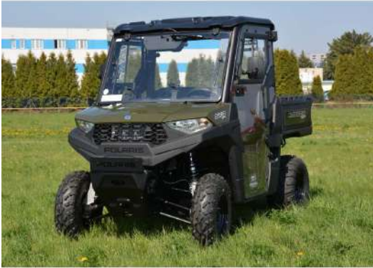
KIT CABINE COMPLÈTE [#DFK-32S09U02-1]