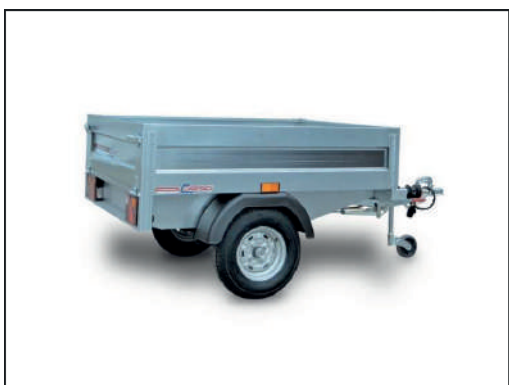
CRESCI B3 (Remorque pour quad)