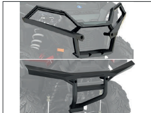
BUMPER AV/ARR [#2882020/#2882583]