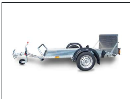
CRESCI PT4 S.F.