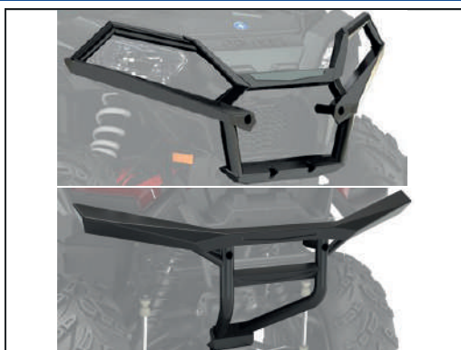
BUMPER AV/ARR [#2882020/#2882583]