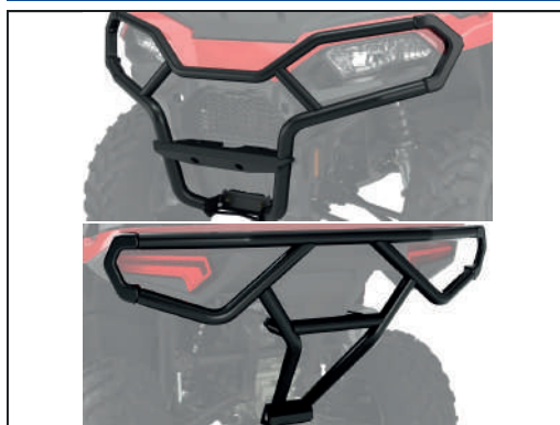
BUMPER AV/ARR [#2884844/#2884847]