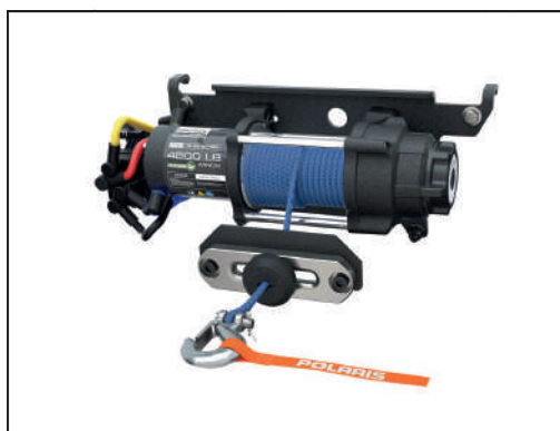
TREUIL PRO HD 4'500 LB [#2882711]