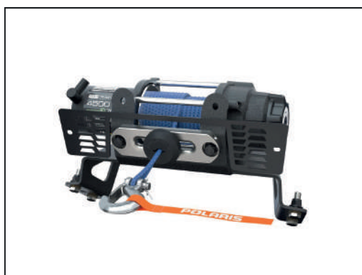
TREUIL PRO HD 4'500 LB [#2882238]