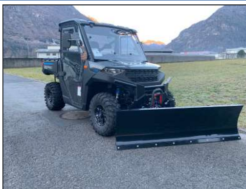
KIT LAME À NEIGE RANGER 1000