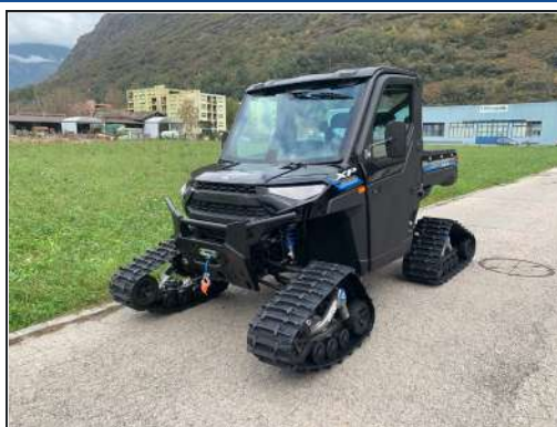
KIT CHENILLES [#2883313]