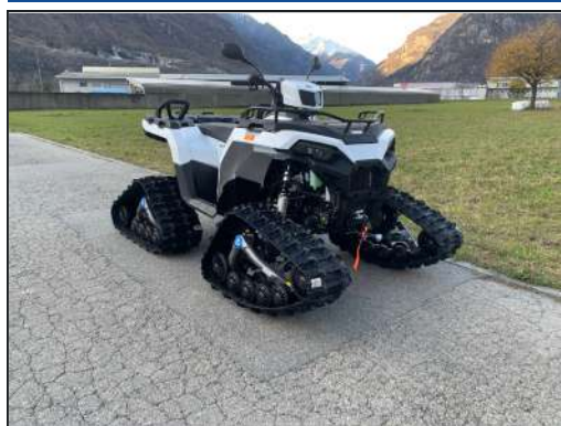
KIT CHENILLES [#2880020]