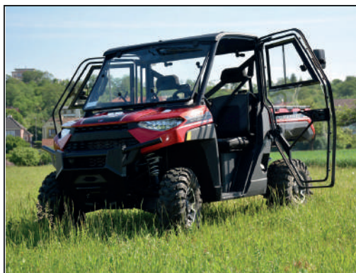
KIT CABINE COMPLÈTE [#DFK-32S12U01-1]