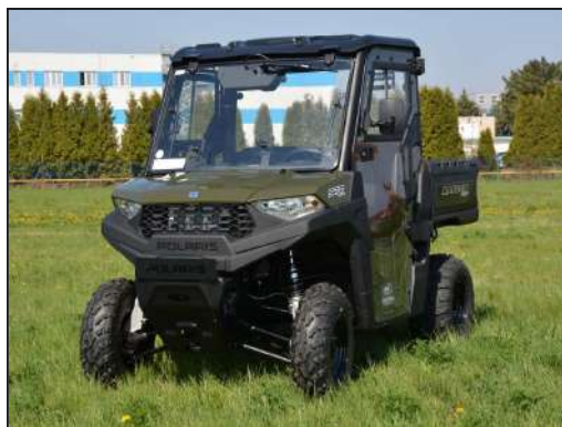
KIT CABINE COMPLÈTE [#DFK-32S09U02-1]