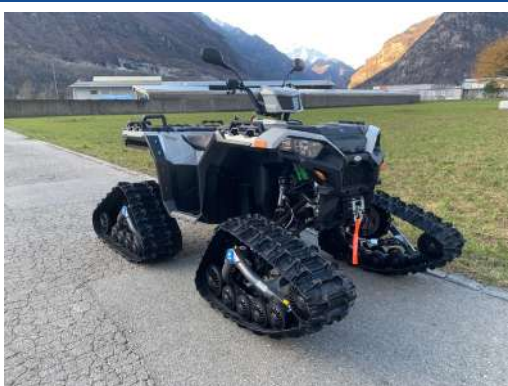
KIT CHENILLES [#2881003]