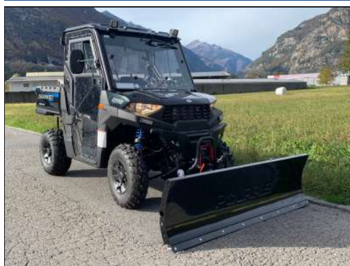
KIT LAME À NEIGE RANGER 570